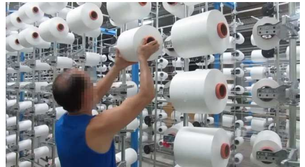
Trabajador colocando la bobina en la sexta fila