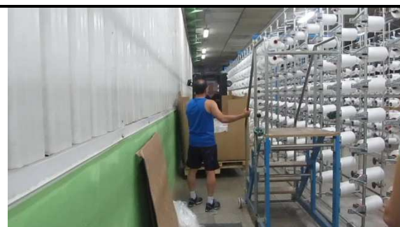
Los trabajadores conducen la carretilla elevadora