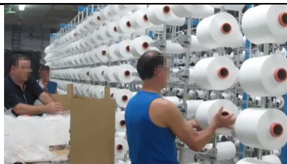
El trabajador realiza otras tareas además de la descrita en la presente evaluación