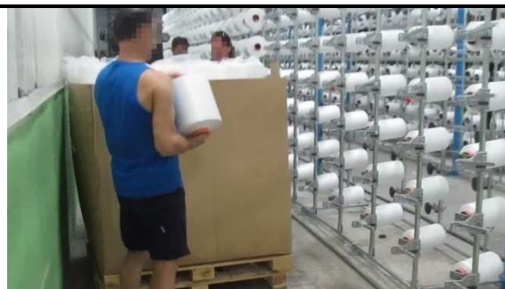
La bobina pesa de 3 a 5 kg

J. De media, ¿cuánto tiempo pasas al día en esta tarea?