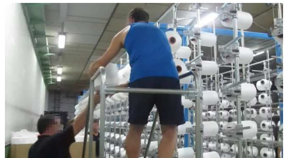
Trabajador recibiendo la bobina

B. Selecciona SOLO UNA de las siguientes opciones: