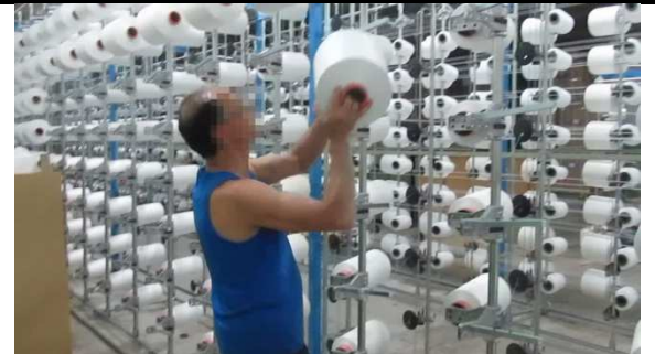
Trabajador colocando la bobina en el vástago