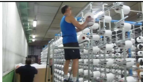
La fuerza que dice ejercer es moderada