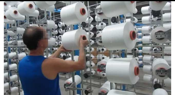
Desviación en dirección cubital de muñeca al colocar la bobina