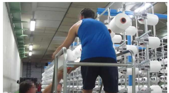
Recibiendo la bobina

B5 Muy frecuente (sobre 12 veces por minuto o más)