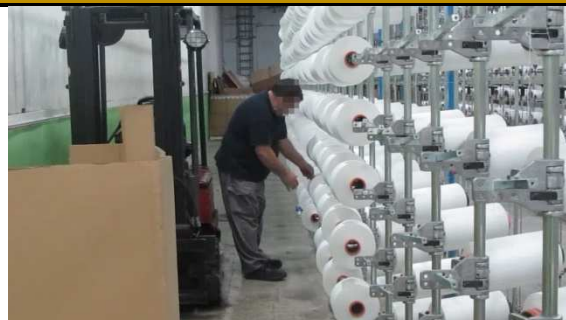
Trabajador colocando las filas inferiores