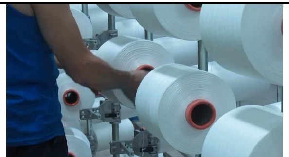
El movimiento es menor de 10 veces por minuto