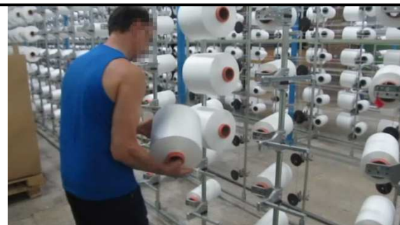
No requiere mayor demanda visual

L2 Alta (necesidad de observar detalles precisos)